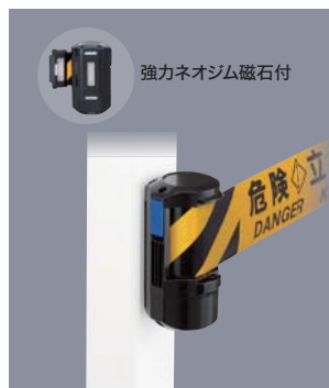
マグネットタイプ