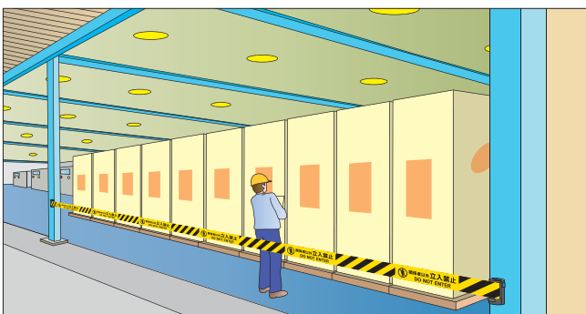
柱間隔の広い工場 (Wバリアリール)