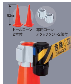
トールコーンタイプ (トールコーン2本付)