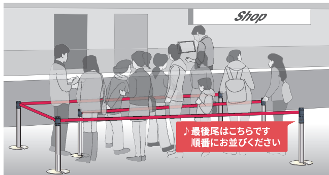
人気店舗の行列規制