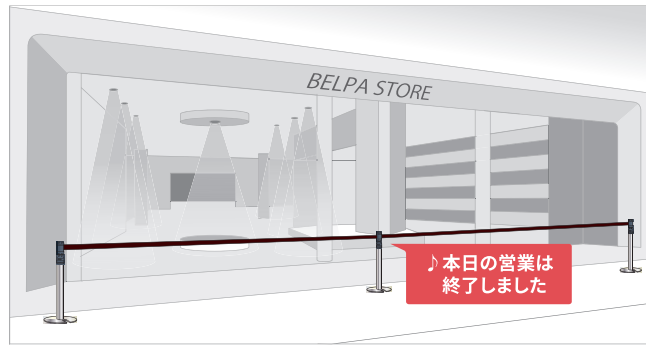
営業時間が異なる店舗の仕切り