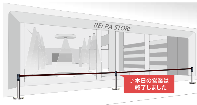
営業時間が異なる店舗の仕切り