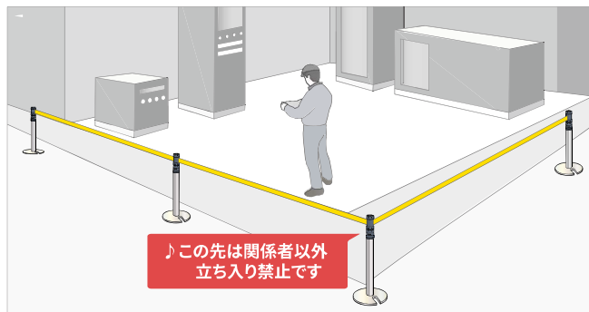
工場作業エリアへの立ち入り規制