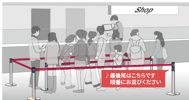
人気店舗の行列規制