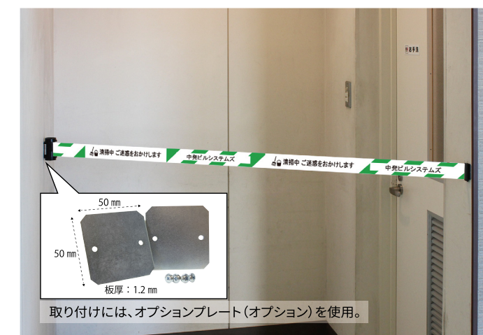
写真は「バリアリアルminiポータブル」